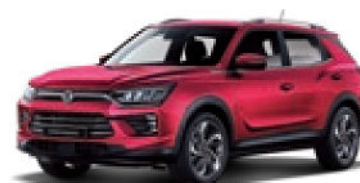
Cherry Red (RAV)*

* Metallic-Lackierung Peinture métallisée Vernice metallizzata