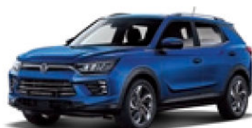
Dandy Blue (BAS)*