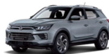
Platinum Gray (ADA)*