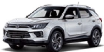
Grand White (WAA)