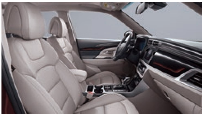
Interieur Grau–Gris-Grigio / Beige

* Metallic-Lackierung Peinture métallisée Vernice metallizzata