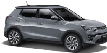
Platinum Gray (ADA)*