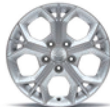
16" Leichtmetallfelgen mit Reifen der Grösse 205/65

Jantes en alliage de 16" Dimensions pneus 205 / 65