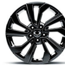
18" Leichtmetallfelgen schwarz mit Reifen der Grösse 215/50

Cerchi di lega 16" Dimensioni gomme 205/65