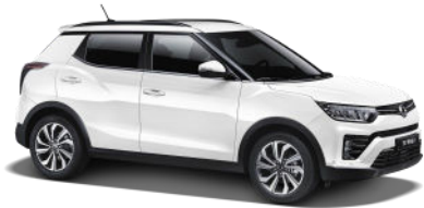
Grand White (WAA)