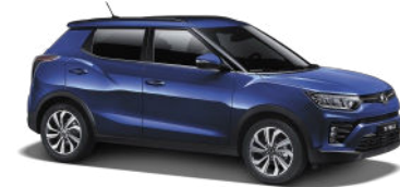
Dandy Blue (BAS)*