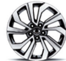
18" Leichtmetallfelgen „Diamond Cut“ mit Reifen der Grösse 215/50

Cerchi di lega 18" nero Dimensioni gomme 215/50