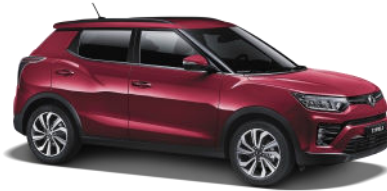
Cherry Red (RAV)*