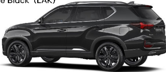
Space Black (LAK)