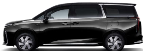
Obsidian Black Metallic