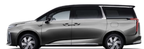
Meteorite Lime Metallic

Preise und Ausstattung zum Zeitpunkt der Drucklegung. Die Maxomotive Schweiz AG behält sich das Recht vor, Preise, Ausstattung oder Daten jederzeit und ohne Vorankündigung zu ändern. Alle Angaben ohne Gewähr. Diese Preisliste ersetzt alle vorgängigen