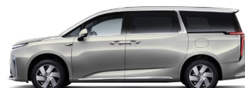
Pearl White Metallic