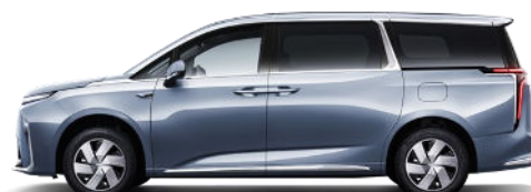
Mica Blue Metallic